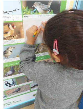
איור 2 העתקת ציפורים