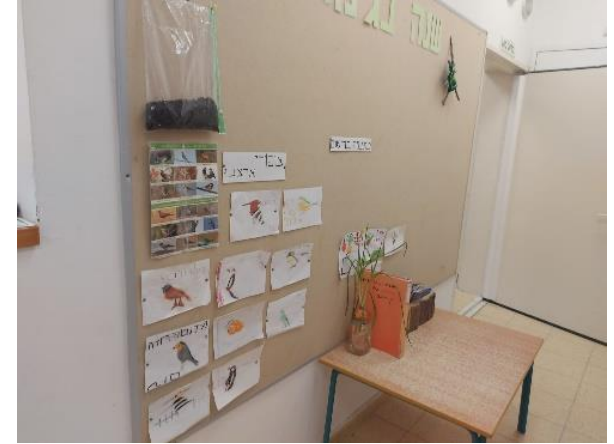
איור 5 לוח תוכן ומרכז החקר