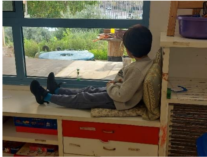
איור 10 מרחב ההתבוננות- החוצה או פנימה