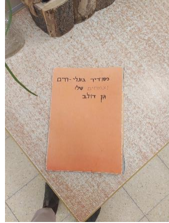
איור 7 קלסר מגדיר בעלי חיים של גן דולב