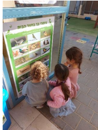
איור 3 העתקת ציפורים בגינה