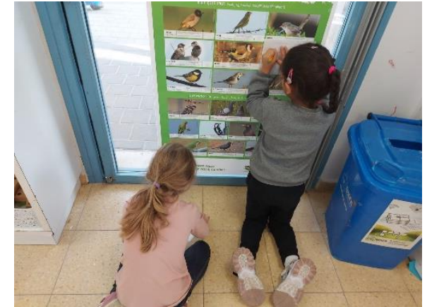
איור 1 העתקת ציפורים