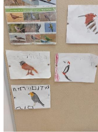
איור 6 לוח תוכן ומרכז החקר