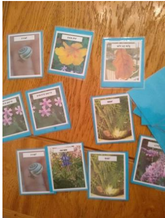
איור 4 משחק זיכרון מתמונות פרחי הגינה