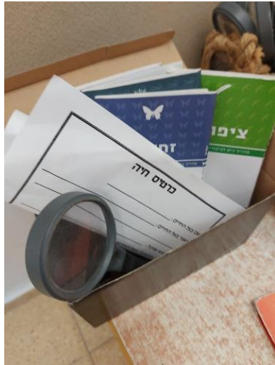
איור 11 קופסת החקר