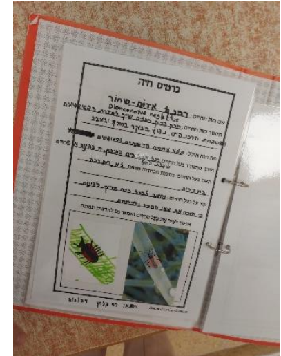
איור 9 קלסר מגדיר בעלי חיים של גן דולב